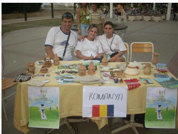
Studenți reprezentând România în Turcia

O descriere amănunțită a metodologiei de organizare, a obiectivelor practicii de specialitate și voluntare pe ani de studiu, a tipurilor de activități propuse, a modelelor de documente pe care studenții, tutorii de practică și profesorii coordonatori trebuie să le completeze, precum și a modalităților de evaluare ale studenților pot fi urmărite în Anexa B30 ce reprezintă manualul de practică.