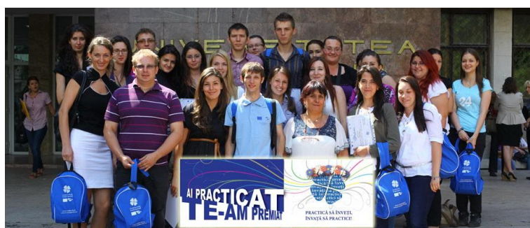
Studenții premiați ai Depart. As. Soc. la concursul Cel mai bun student practicant