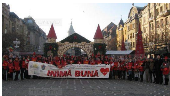
Studenți la strângere de fonduri în campania Inimă bună.